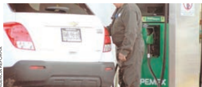
Las gasolinas se mantendrán con el mismo precio en mayo.

Hacienda informó que se realizó una modificación metodológica en su